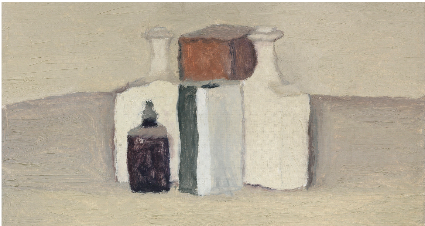
Giorgio Morandi, Natura morta , 1958