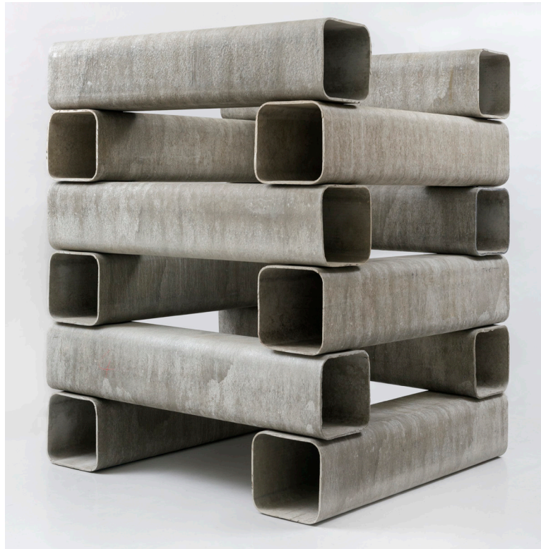
Alighiero Boetti, Catasta , 1967-92, 12 éléments en Eternit, 187 x 150 x 150 cm