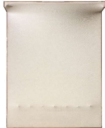
Enrico Castellani, Superficie bianca n°5, 1964 tempera sur toile exoflexe 146 x 114 x 30 cm