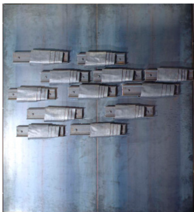
Jannis Kounellis, Senza titolo, 1989 fer et plomb 183 x 206 x 12 cm