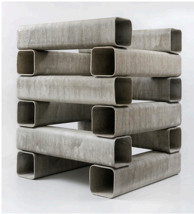
Alighiero Boetti, Catasta, 1967-92 12 éléments en Eternit, 187 x 150 x 150 cm