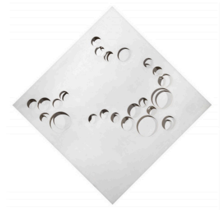
Paolo Scheggi, Intersuperficie curva bianca, 1967 acrylique sur trois toiles superposées 140 x 140 x 7 cm