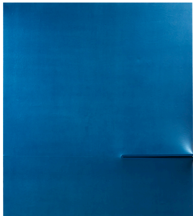
Agostino Bonalumi, Blu, 1972 tempera sur toile exoflexe 180 x 160 cm