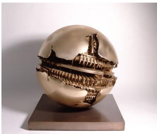
Sphère 1990, Bronze Ø 50 cm