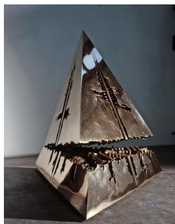
Asse del movimento, II, 1983-1987 bronze, 170 x 175 x 150 cm