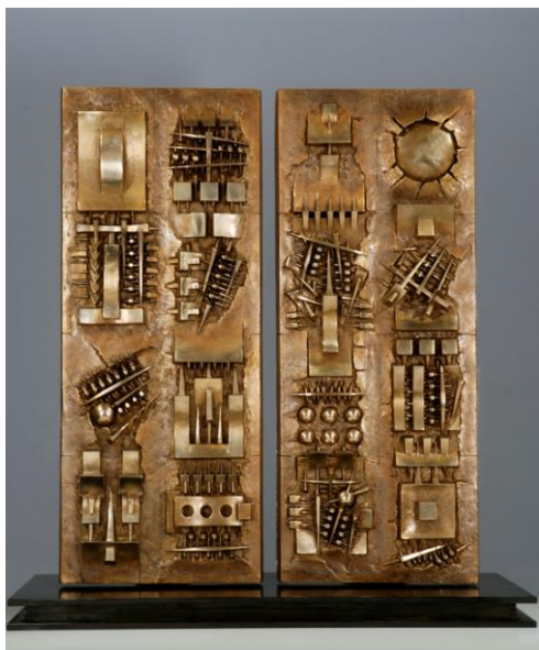
Grande Porte Marco Polo, studio, 1988-2008 Bronze, 121 x 102 x 20 cm

C'est donc un véritable challenge pour Tornabuoni Art de rassembler cinquante œuvres parmi les plus emblématiques de la carrière de l'artiste. Une exposition que la galerie prépare avec Arnaldo Pomodoro depuis un an et demi et qui devrait être un événement culturel majeur de l'année 2011.