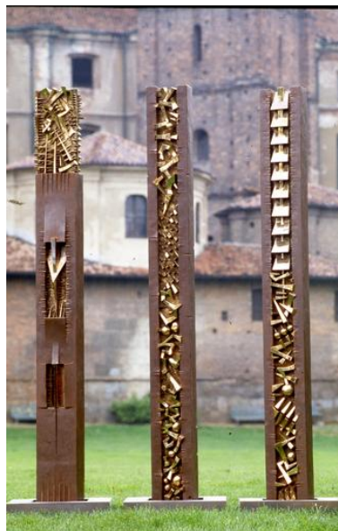
Stèle, I, II, III 1997 Bronze, 250 x 25 x 15 cm