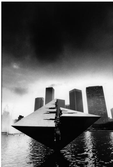
A Los Angeles

http://www.arnaldopomodoro.it/opere_mondo.php