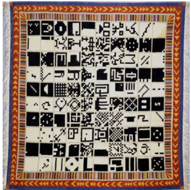
Alternant de 1 à 100 et vice-versa, 1993 Kilim coton et laine 284x288 cm.

Au début des années 70, il scinde son nom en deux, geste qui participe de sa réflexion sur sa propre identité et des multiples personnalités contenues dans l'individu.