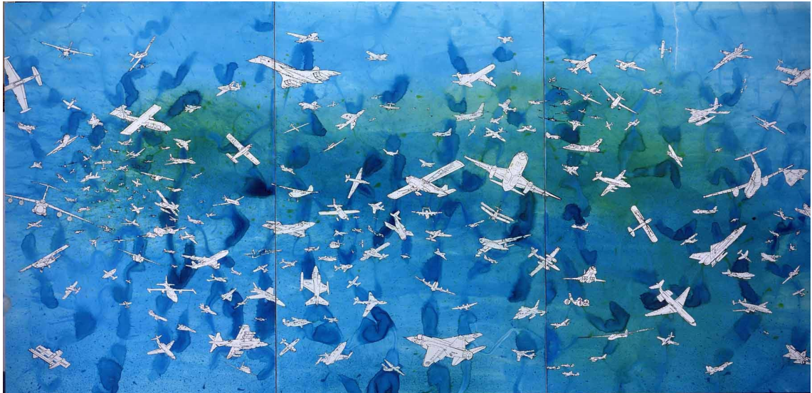
Aerei (Avions), 1989, encre et aquarelle sur papier photographique marouflé, 150x300cm en 3 panneaux de 150x100cm chacun

Alors que vient d'être publié le Catalogue général de l'Oeuvre d'Alighiero et Boetti par les éditions Electa, établi par l'archivio Alighiero Boetti, sous la direction scientifique de Jean-Christophe Ammann, (présenté le 24 février prochain au musée MAXXI de Rome), la galerie Tornabuoni Art organise l'une des plus importantes expositions jamais réalisées en France consacrée au père de l'art conceptuel d'après guerre. Les œuvres de Boetti figurent dans les collections permanentes des plus importants musées internationaux (du MoMA au Centre Georges Pompidou,) et de nombreux musées ont consacré des expositions thématiques à l'artiste (Londres, Chicago, Turin, Naples, Dijon, Grenoble...).