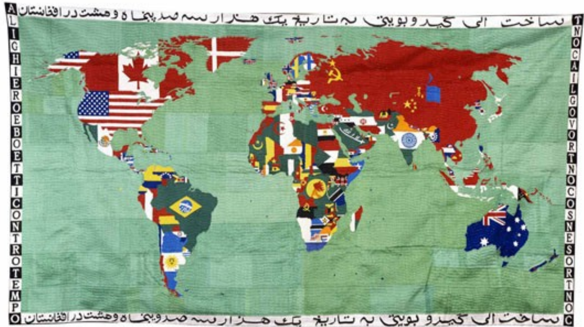
Mappa (Planisphère), 1988 Broderie sur tissu, 120x225 cm.

Les planisphères que Boetti réalisera à partir de 1971 et jusqu'à la fin de sa vie, sont une description géopolitique du monde, où nations et drapeaux sont modifiés selon le cours des événements politiques. La succession temporelle des cartes est donc la narration de l'ordre et du désordre du monde.